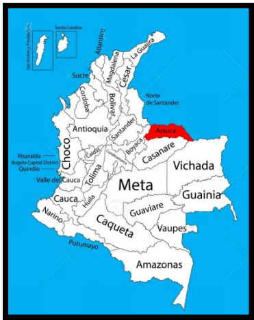
1.1 Arauca en el territorio Colombiano

Arauca es un departamento de Colombia ubicado en la región de los Llanos Orientales, en el extremo noreste del país, limitando al norte con Venezuela y al este con el río Arauca que lo separa de este. Su capital es la ciudad de Arauca, y su territorio abarca una superficie de 23.818 km 2 . Limita al norte con los estados venezolanos de Apure y Barinas, al este con Venezuela, al sur con los departamentos de Boyacá y Casanare, y al oeste con los departamentos de Boyacá y Norte de Santander