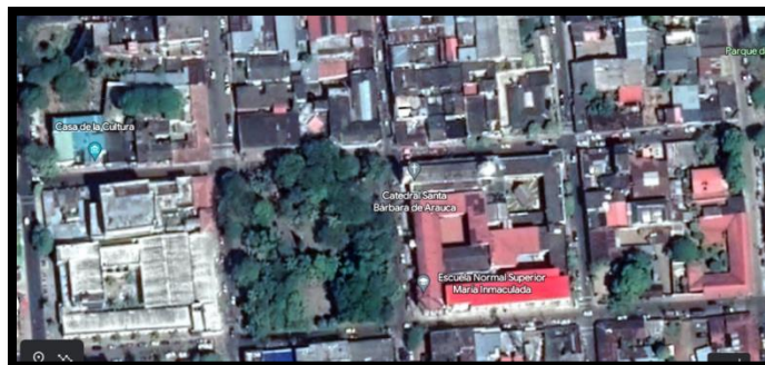
1.3 Escuela Normal Superior María Inmaculada en Arauca